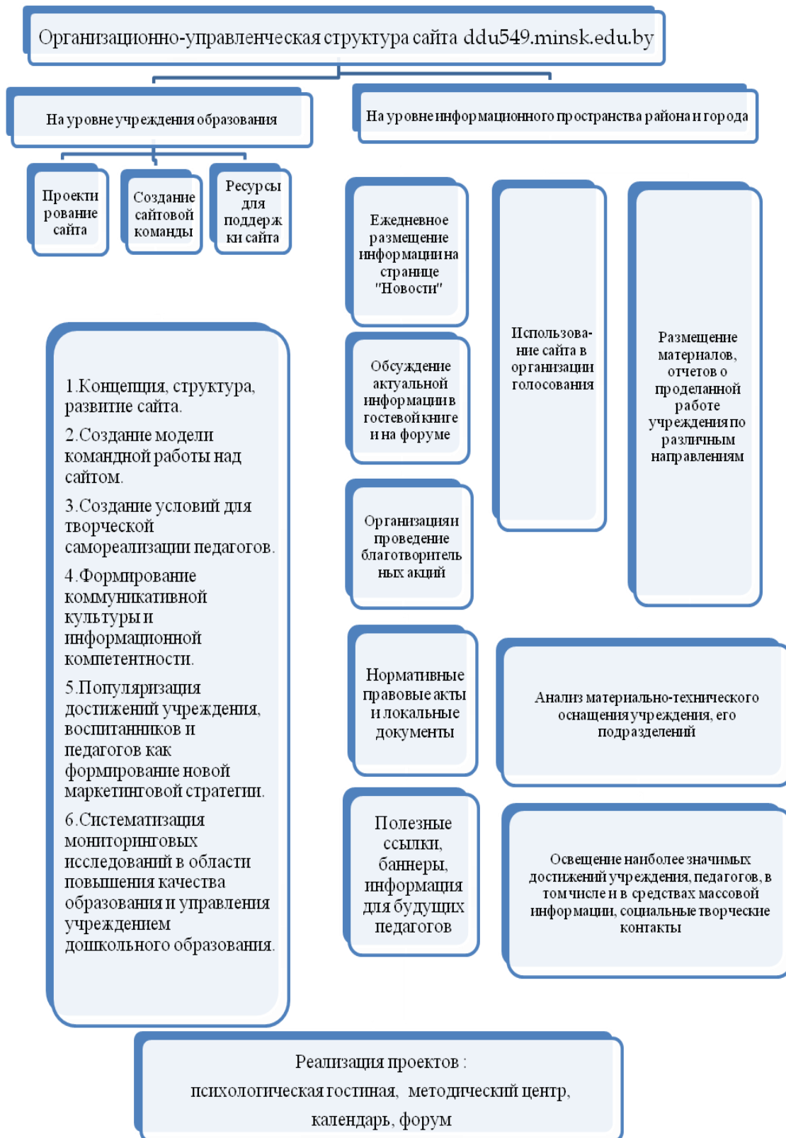
Рис. 2. Организационно-управленческая структура интернет-сайта